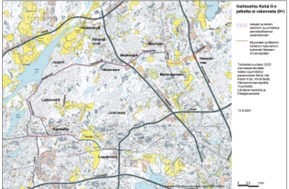
Vaihtoehto Kehä II:n jatketta ei rakenneta.