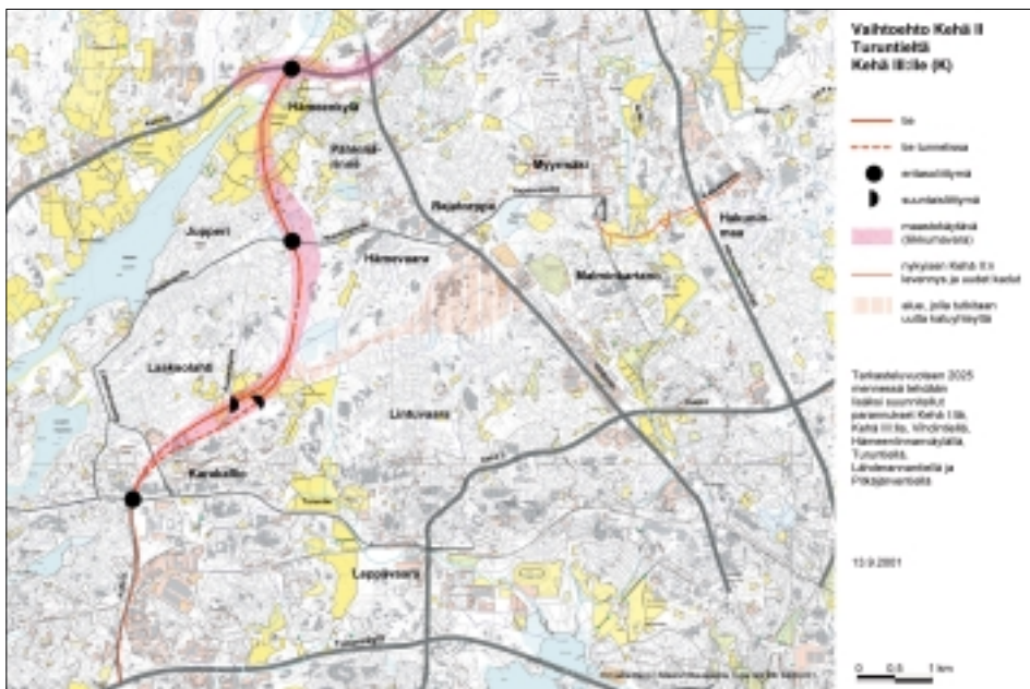
Vaihtoehto Kehä II Turuntieltä Kehä III:lle.