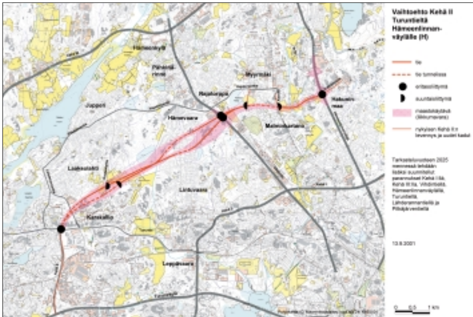
Vaihtoehto Kehä II Turuntieltä Hämeenlinnanväylälle.